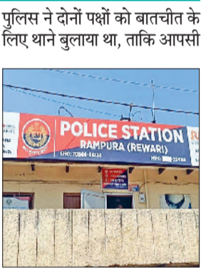
रेवाड़ी। पुलिस स्टेशन रामपुरा।