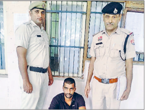
ड्यूटी मजिस्ट्रेट को साथ लेकर आरोपी की तलाशी ली गई तो आरोपी के कब्जे से 33.98 ग्राम नशीला पदार्थ गांजा बरामद हुआ। पुलिस ने आरोपी के खिलाफ एनडीपीएस एक्ट के तहत केस दर्ज कर लिया। बाद में उसे कोर्ट में पेश करते हुए जेल भेज दिया गया।