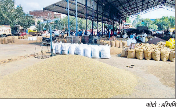
कोटा : हरिभूमि

बबांद कर दिया है, जिससे उत्पादन में भारी कमी आई है। इस समय बाजरा निकालने के बाद किसान उसे मंडियों में पहुंचा रहे हैं, लेकिन बाजरे के पर्याप्त दाम नहीं मिल पा रहे हैं। अनाजमंडी में बाजरे की दैनिक आवक 10 हजार बैग तक पहुंचे हैं। सरकारी समर्थन मूल्य 2775 रुपये प्रति क्विंटल है, जबकि मंडी में किसानों का बाजरा 1750 रुपये से 2350 रुपये प्रति क्विंटल ही बिक रहा है। एक ओर बाजरे की गुणवत्ता का बहाना बनाकर उसे सस्ते दामों पर खरीदा जा रहा है, तो दूसरी ओर बड़ी संख्या में