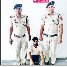
रेवाड़ी। चोरी का आरोपी पुलिस टीम के साथ।