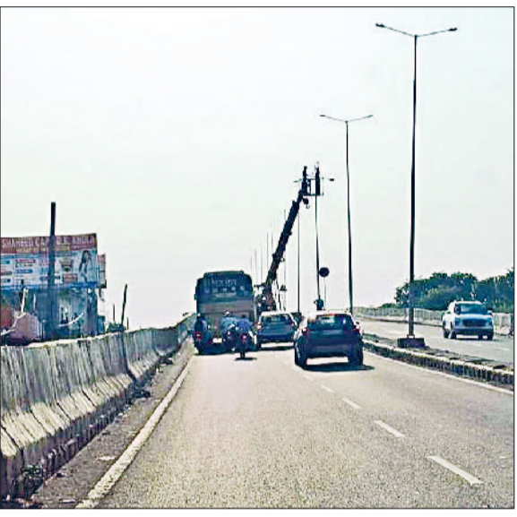
रेवाड़ी। नारनौल रोड फ्लाईओवर पर लगाई जा रही लाइटें, झज्जर रोड बाइपास पर कई माह से बंद पड़ी लाइटें।

शहर के नाईवाली चौक को जैसलमेर नेशनल हाइवे से जोड़ने वाली सड़क पर बने बाइपास फ्लाईओवर को जगमग करने के लिए लाइट लगाने का कार्य शुरू कर दिया गया है। एचएसआरडीसी की ओर से लाइटें लगवाने का कार्य शुरू किया गया है। इससे पूर्व लगभग 3 करोड़ रुपये की लागत से इसी रोड को झज्जर रोड से जोड़ने वाले बाइपास पर लाइटें लगाई गई थीं, जिनका बिजली कनेक्शन करीब 6 माह बाद भी नहीं हो सका है। यह लाइटें बिजली कनेक्शन के अभाव में बंद पड़ी हैं, जबकि नई लाइटों के कनेक्शन को लेकर भी स्थिति