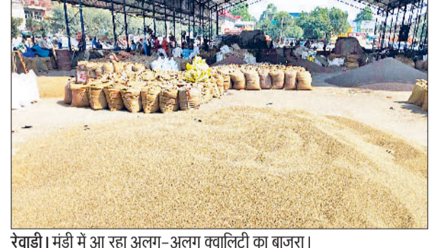
रेवाड़ी। मंडी में अ राहा अलग-अलग क्वालिटी का बाजरा।

सितंबर माह के पहले सप्ताह तक हुई बरसात ने किसानों की बाजरे की फसल को बुरी तरह प्रभावित किया है। फसल उत्पादन में काफी कमी आई है। अब मंडियों में बाजरा लेकर पहुंच रहे किसानों को फसल बेचने में निराशा का सामना करना पड़ रहा है। क्वालिटी बरसात से प्रभावित होने के कारण उच्च उचित दाम नहीं मिल रहे हैं। सरकारी खरीद 1 अक्टूबर से शुरू होने की संभावना जताई जा रही है, परंतु छोटे किसान अपनी जरूरतों को पूरा करने के लिए तुरंत फसल बेचने को मजबूर हैं। इससे उन्हें भारी आर्थिक नुकसान उठाना पड़ रहा है। जिले के किसानों इस बार लगभग 90 हजार हेक्टेयर में बाजरा खेती की है। बरसात के बाद नाहड़ एरिया में कई किसानों की फसल सौ फीसदी तक खराब हो चुकी है। बड़ी संख्या में किसानों का बाजरा बारिश ने