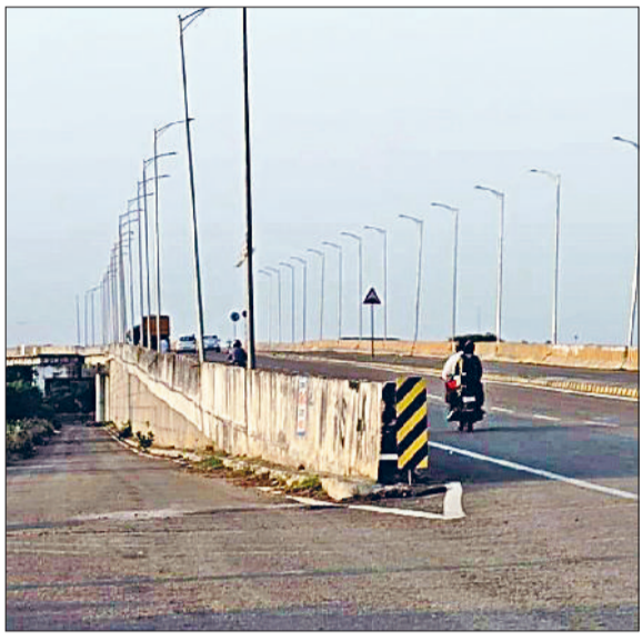
रेवाड़ी। एचएसआरडीसी के अधिकारियों ने संबंधित ग्राम पंचायतों से भी बाइपास पर लगवाई लाइटों के बिजली कनेक्शन कराने का आग्रह किया था, लेकिन अधिकांश ग्राम पंचायतों ने ऐसा करने से मना कर दिया था। इन ग्राम पंचायतों के सरपंचों का तर्क है कि चूँकि

साफ नहीं है। हरिनगर के पास फ्लाईओवर पर बने टी-जंक्शन से झज्जर रोड को जोड़ने वाला बाइपास हरियाणा राज्य सड़क विकास निगम के अधीन आता है। इस बाइपास के निर्माण के बाद निगम ने रात के समय अंधेरे से निजात दिलाने के लिए सैकड़ों लाइटें दोनों लेन में लगवाई थीं।