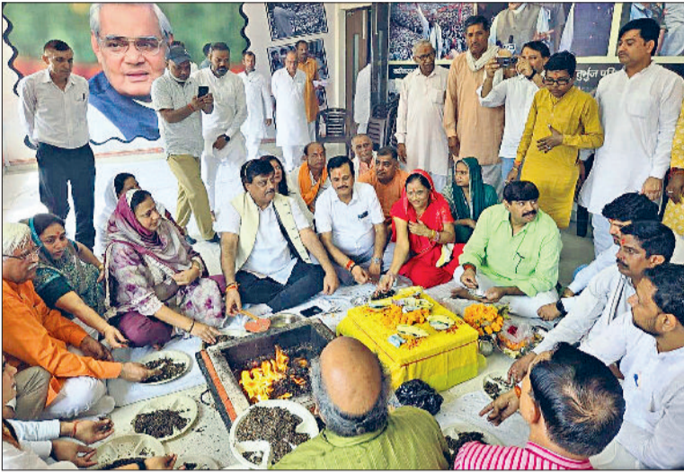
रेवाड़ी। मोदी के जन्मदिन पर हवन करते भाजपाई व रक्तदाता को बैज लगाते भाजपा पदाधिकारी।