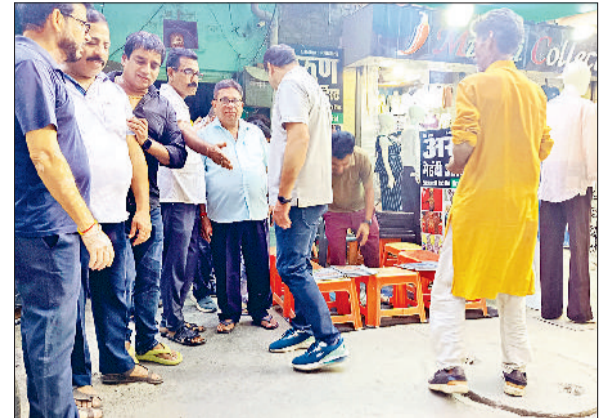
रेवाड़ी। व्यापारियों को अतिक्रमण के संबंध में हिदायत देते संगठन के पदाधिकारी।