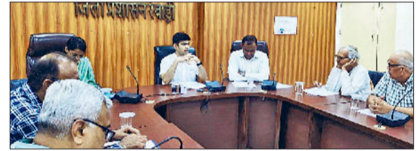
रेवाड़ी। बैठक को संबोधित करते हुए डीसी अभिषेक मीणा।

डीसी एवं जिला निर्वाचन अधिकारी अभिषेक मीणा ने कहा कि भारत निर्वाचन आयोग ने स्पेशल इंटेन्सिव रिवीजन हरियाणा में शुरू करवाने की तैयारी कर ली है। अगले माह के प्रथम सप्ताह में विधिवत रूप से करीब तीन महीने के इस अभियान को शुरू कर दिया जाएगा। डीसी जिला सचिवालय के सभागार में बुधवार को राजनीतिक दलों के प्रतिनिधियों की बैठक को संबोधित कर रहे थे। उन्होंने कहा कि हर 25 साल के बाद इस विशेष गहन पुनरीक्षण अभियान को चलाया जाता है। इस बार वर्ष 2002 की मतदाता सूची के आधार पर वर्तमान वोटर लिस्ट की तुलनात्मक रिपोर्ट तैयार की जाएगी। जिन लोगों के