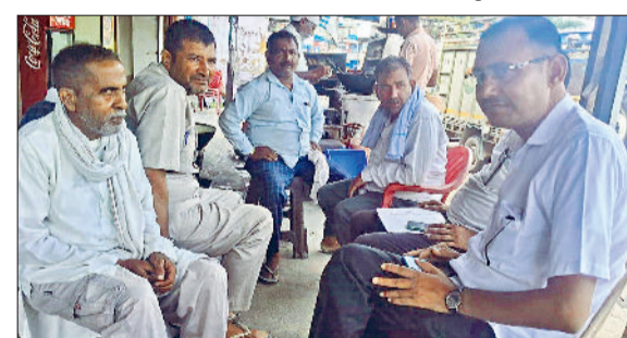
रेवाड़ी। ग्रामीणों को नशे के प्रति जागरूक करते पुलिसकर्मी।